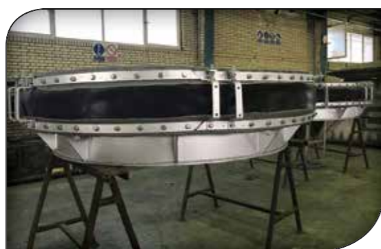
اتصالات انبساطی پارچه ای (2) expansion joint

مدرن و بروز رسانی عایق آزیستی توربین بخار با عایق های ژاکتی حرارتی: