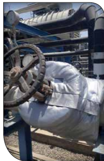
عایق ژاکتی شیر آلات، فلنج های صنعتی