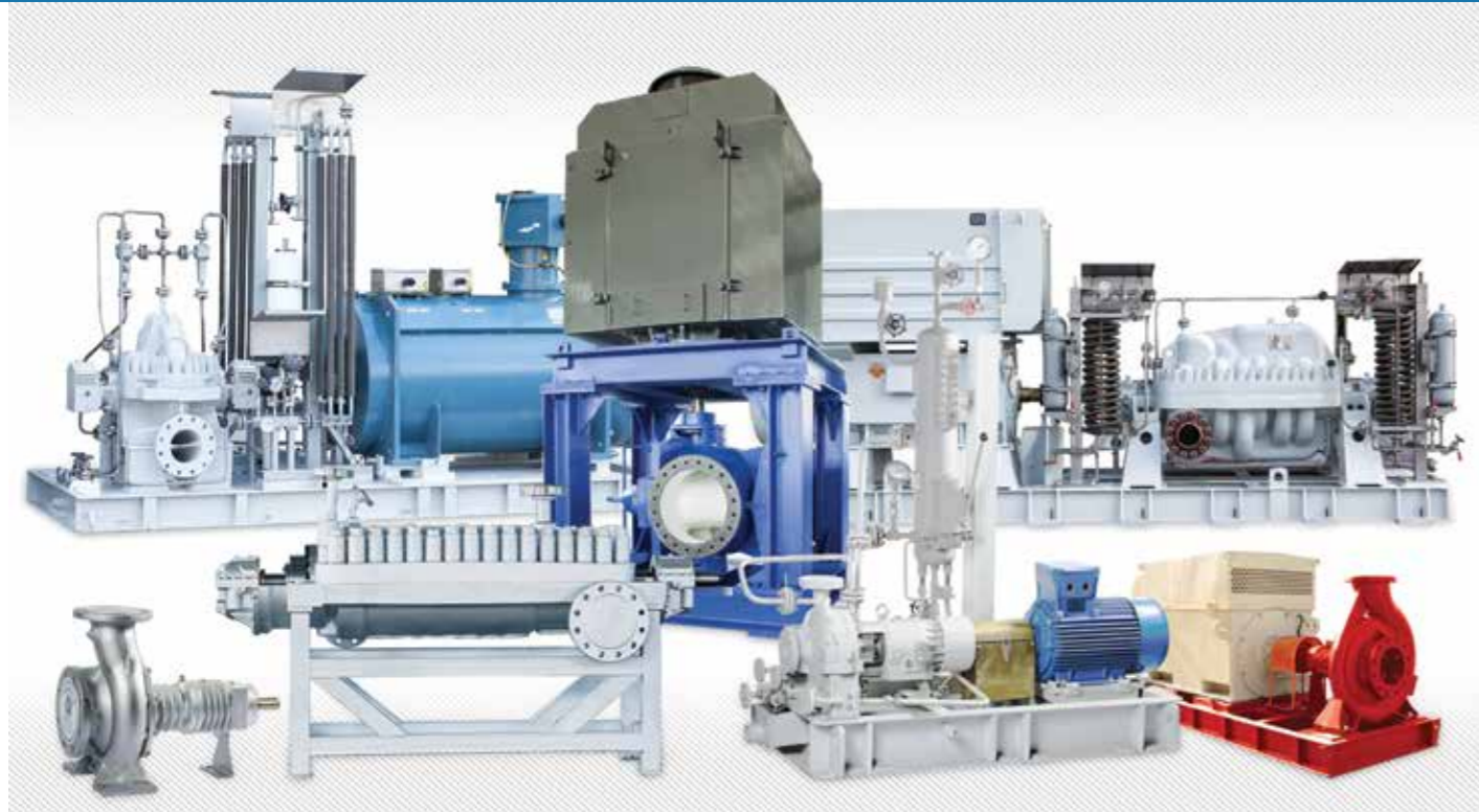
■ اهم محصولات تولید شده / خدمات تخصصی