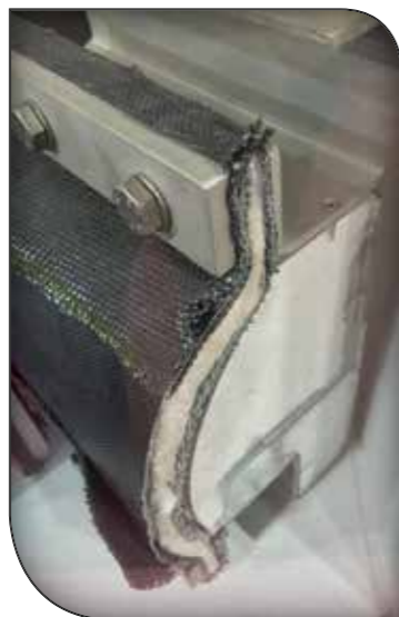
اتصالات انبساطی پارچه ای expansion joint